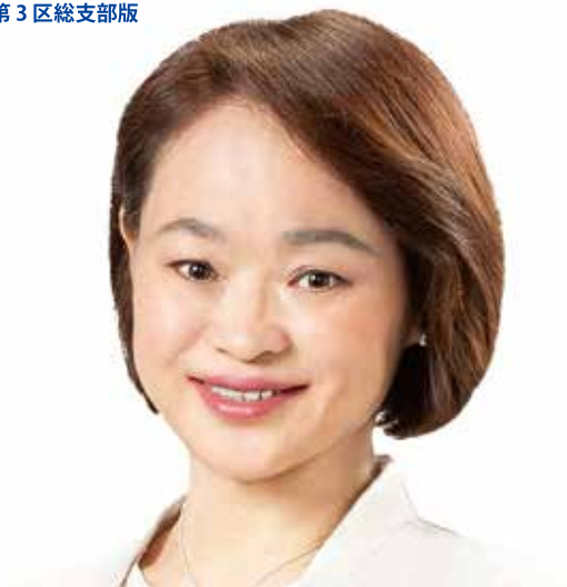
立憲民主党大分県第3区総支部長